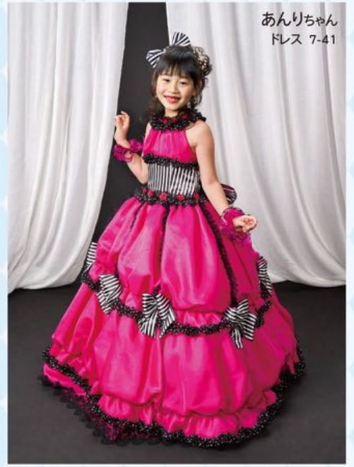
あんりちゃん ドレス 7-41