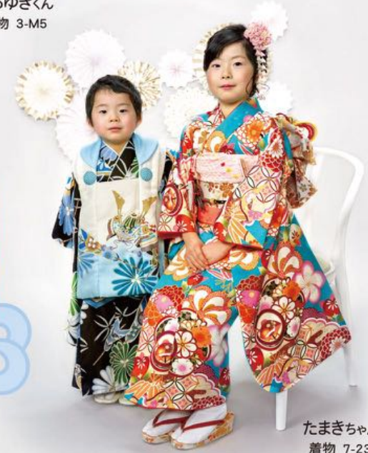
たまぎちゃん 着物 7-23