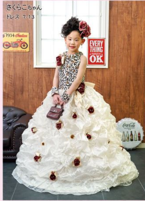
さくらこちゃん ドレス 7-13