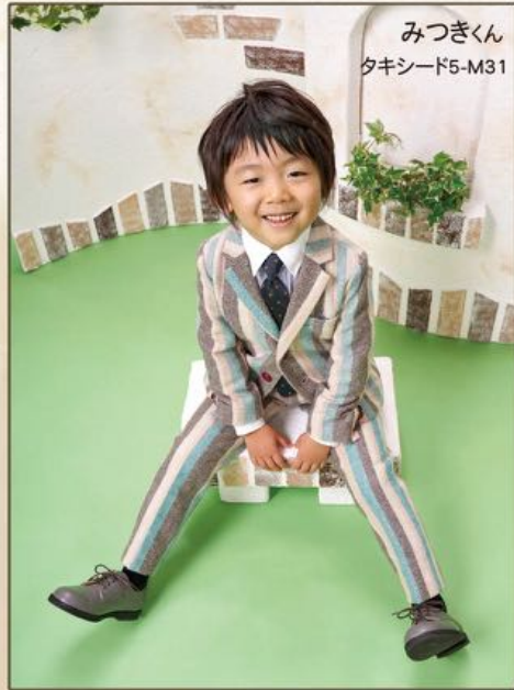
みつぎくん タキシード5-M31