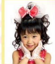
くるくるカールのハーフアップで 気分はお姫様♡