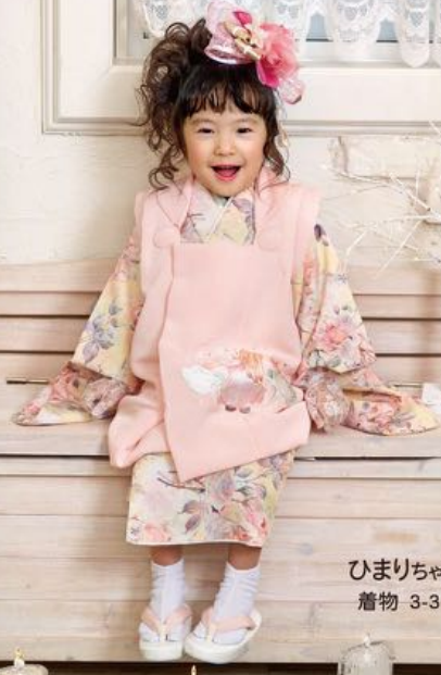
ひまりちゃん 着物 3-3