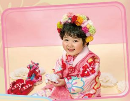
ゆいちゃん 着物 3-76