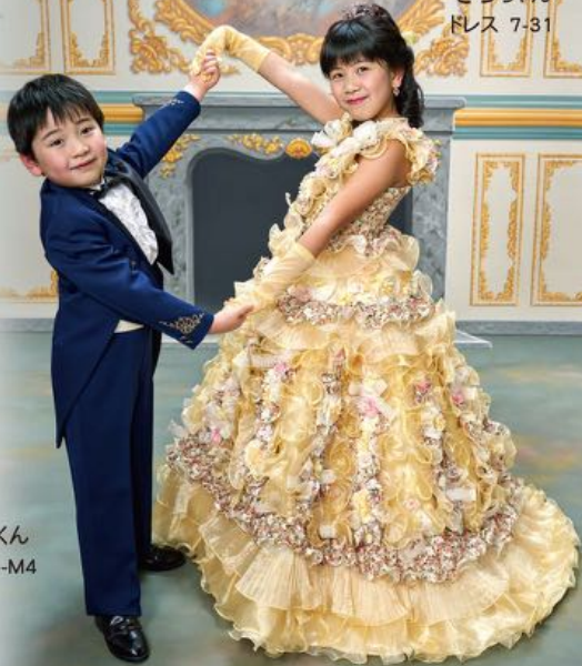
こうようくん タキシード5-M4