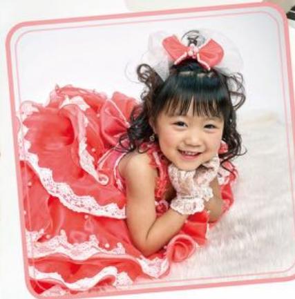
ゆづきちゃん ドレス 3-35