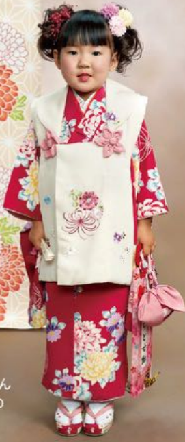
ゆうりちゃん 着物 3-50