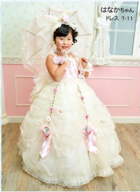
はなかちゃん ドレス 7-11