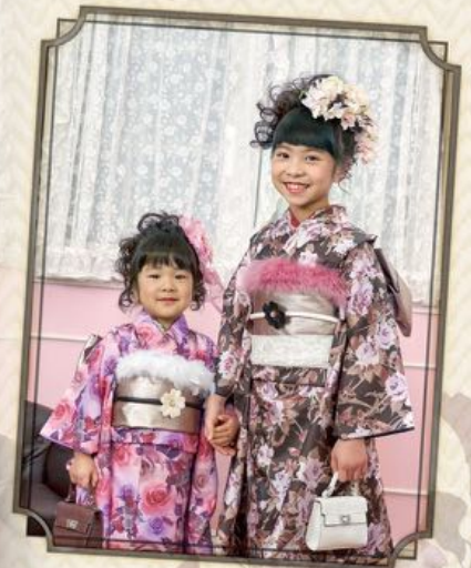
ひまりちゃん 着物 3-48