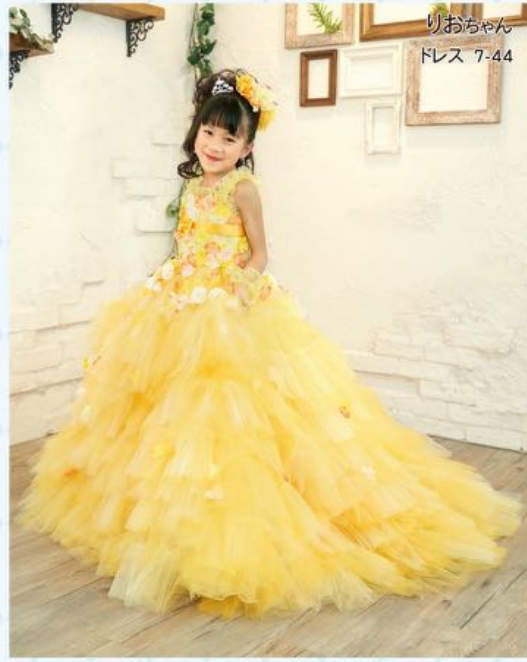
りおちゃん ドレス 7-44