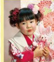
2つ結びのアップで 今ならではかわいらしさを！