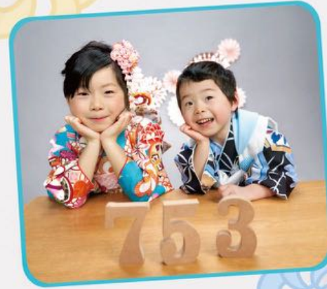
てるゆきくん 着物 3-M5