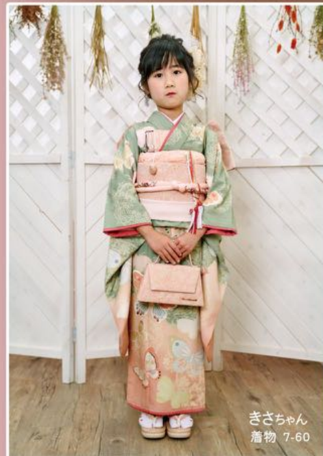
ぎさちゃん 着物 7-60