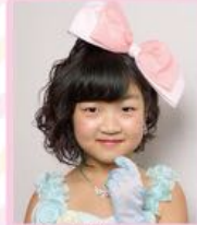
بوبでも巻いて かわいらしく♡