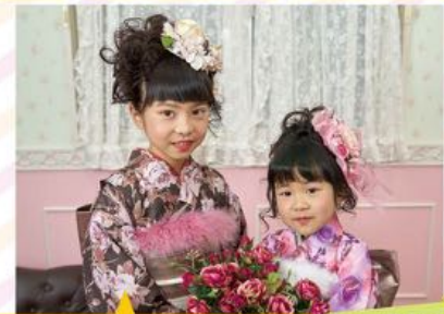
おしゃれなデコノアの着物に合わせたヘアスタイル 7歳3歳 姉妹