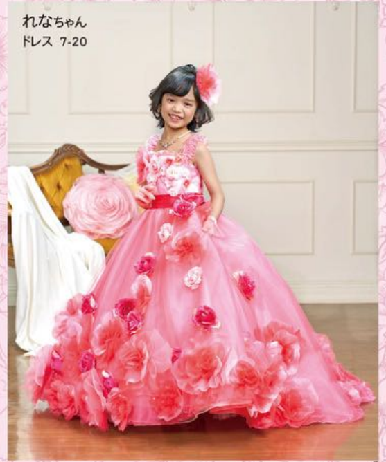
れなちゃん ドレス 7-20