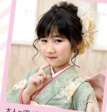
大人っぽいゆるめな下めのスタイル