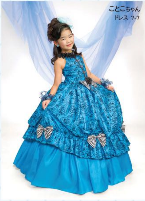
ことこちゃん ドレス 7-7