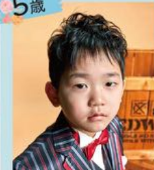
男の子もヘアセットをしてパッチリかっこよく！！