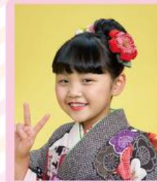
面を出すのも 和な雰囲気ステキ♡