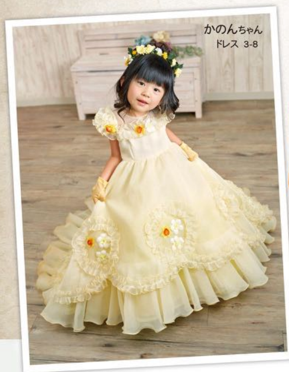
かのんちゃん ドレス 3-8