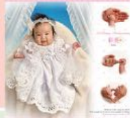
かわいい手足を撮影したデザインフォト

ご家族そろって はじめての記念写真 百日祝い 生後百日目の「お食い初め」に なぞらえて、お子さまの健やかな 成長を願う、大切な記念日です。