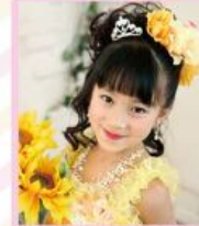
ハーフアップで着物の時と 雰囲気を変えて...