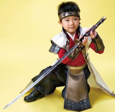
こうしんくん 武将 5-107