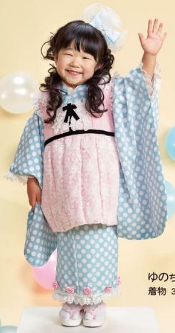
ゆのちゃん 着物 3-44