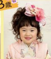
ななめにアップで お姉さんぽく変身♡