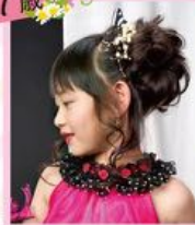
おくれもたっぶりの お姫様ヘア♪