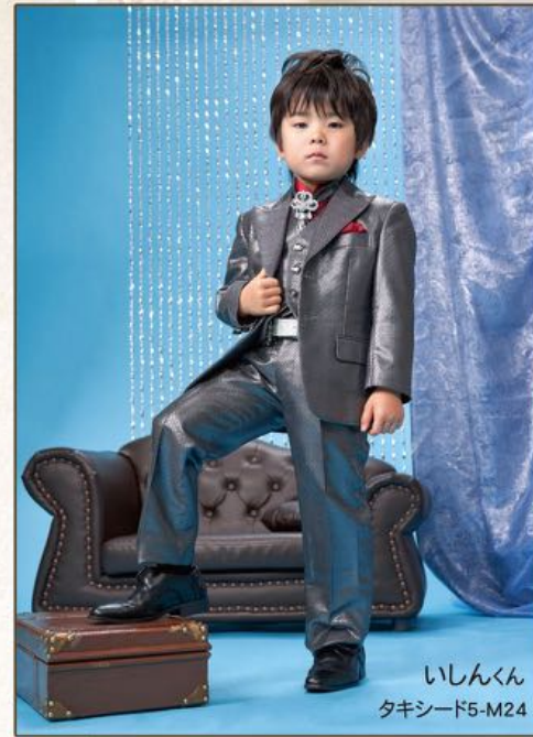
いしんくん タキシード5-M24