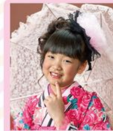
ふわふわ華やか アップスタイル